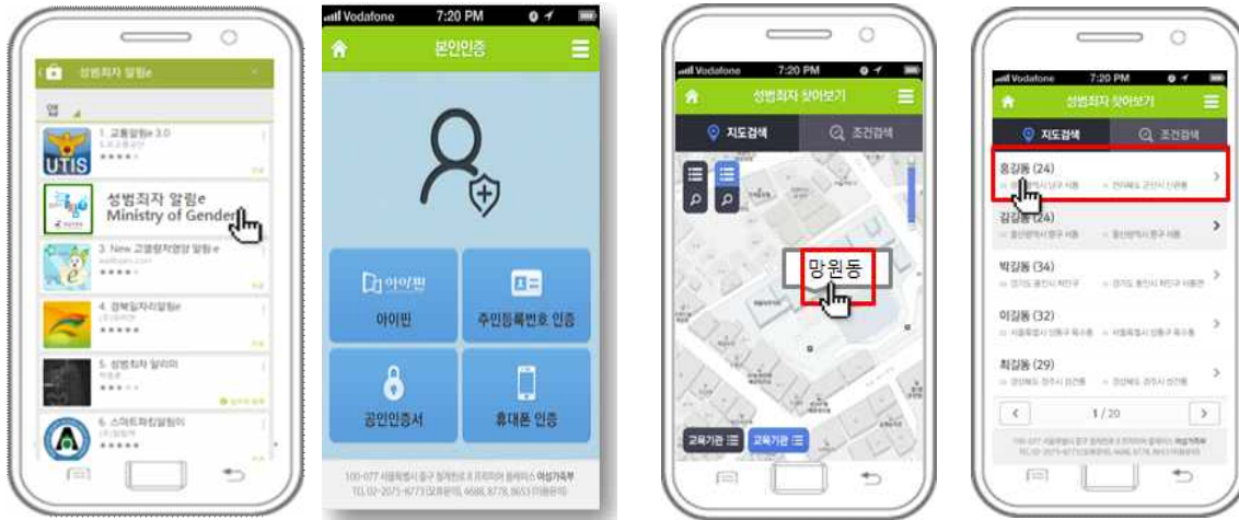
① 앱스토어에서 '성범죄자 알림e' 앱 검색